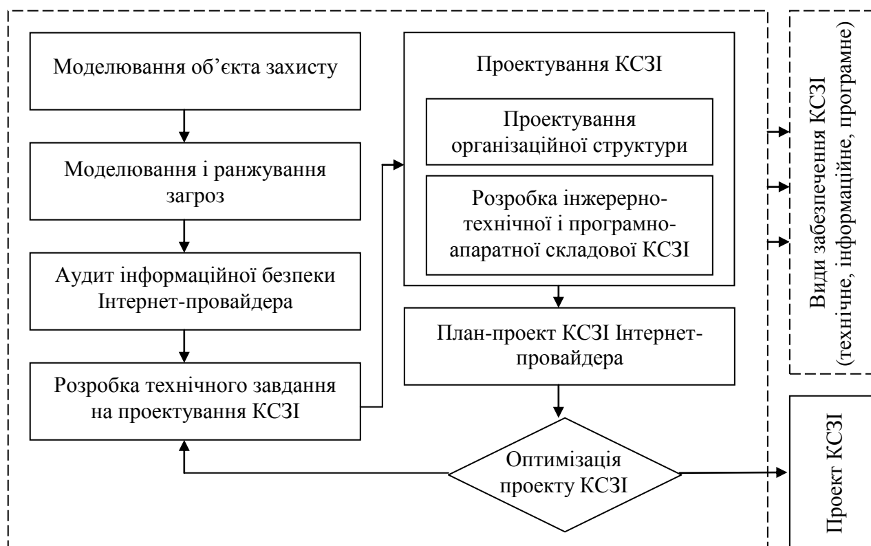
Рис. 2.2. Структурно-функціональна схема КСЗІ